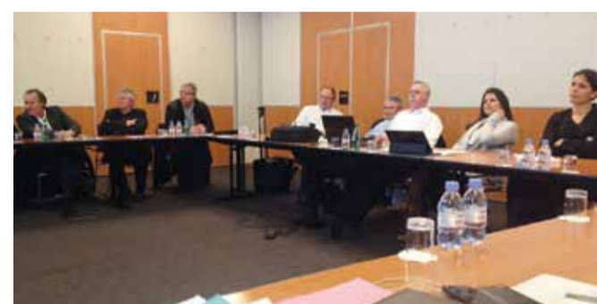
ILE DE FRANCE (24/11/15)