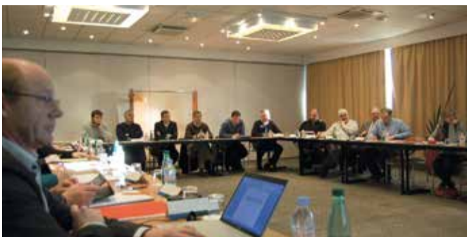
NORD PICARDIE (3/12/15)