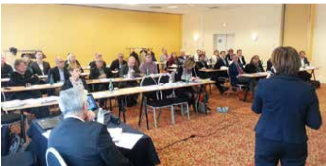
PAYS DE LOIRE (10/12/15)