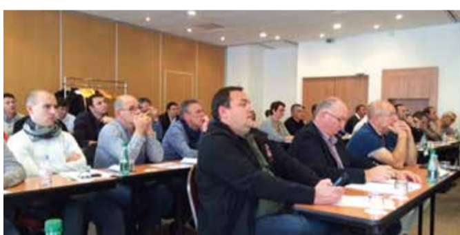
BOURGOGNE FRANCHE-COMTE (17/11/15)