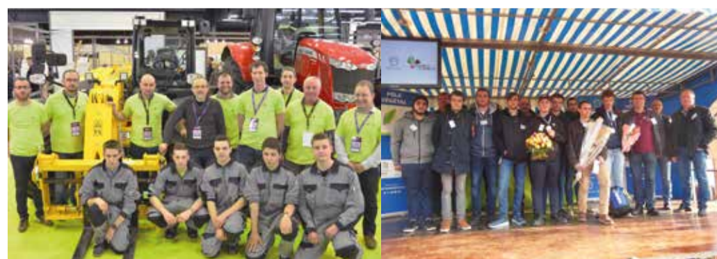
Les candidats et les jurés des Pays de Loire.