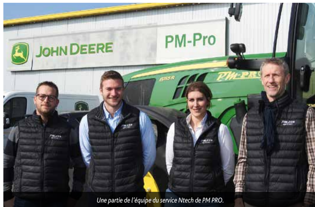
Une partie de l'équipe du service Ntech de PM PRO.

KD : Sur un chiffre global de 95 millions d'€ (PM PRO et TEAM3), la part des nouvelles technologies est de 2,5 millions d'€. Le marché des nouvelles technologies est récent et en devenir, la marge de progression est donc considérable. D'autant que nous nous trouvons dans une région de grandes cultures avec une clientèle réceptive à ce type de produits.