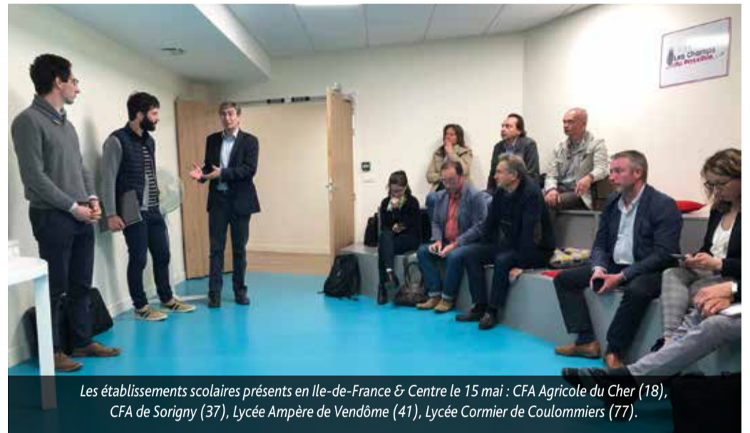
Les établissements scolaires présents en Ile-de-France & Centre le 15 mai : CFA Agricole du Cher (18), CFA de Sorigny (37), Lycée Ampère de Vendôme (41), Lycée Cormier de Coulommiers (77).