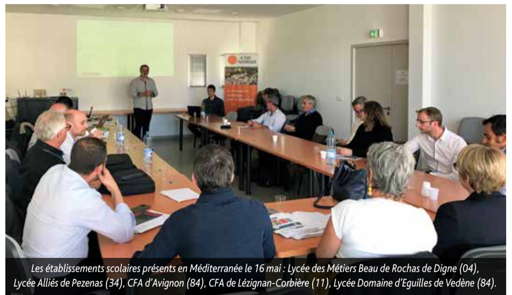
Les établissements scolaires présents en Méditerranée le 16 mai : Lycée des Métiers Beau de Rochas de Digne (04), Lycée Alliés de Pezenas (34), CFA d'Avignon (84), CFA de Lézignan-Corbrière (11), Lycée Domaine d'Eguilles de Vedène (84).