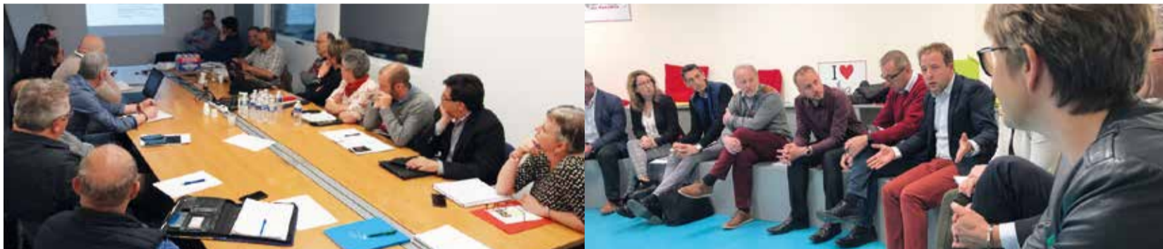
Les trois premières réunions en régions se sont tenues les 14 mai en Midi-Pyrénées, 15 mai en Ile-de-France & Centre, 16 mai en Méditerranée.