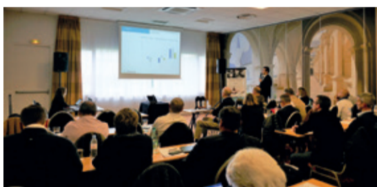
PAYS DE LOIRE (6/11/19)